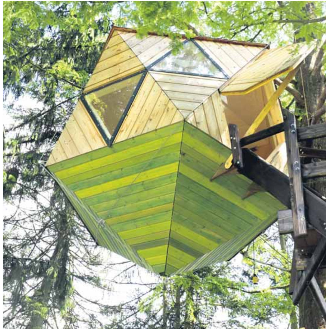
Die untere Spitze des Baumhauses von Thomas Schwerter befindet sich fünf Meter über dem Boden.

Ronsdorfer Schreiner entwickelt ein sehr ungewöhnliches Baumhaus-Design