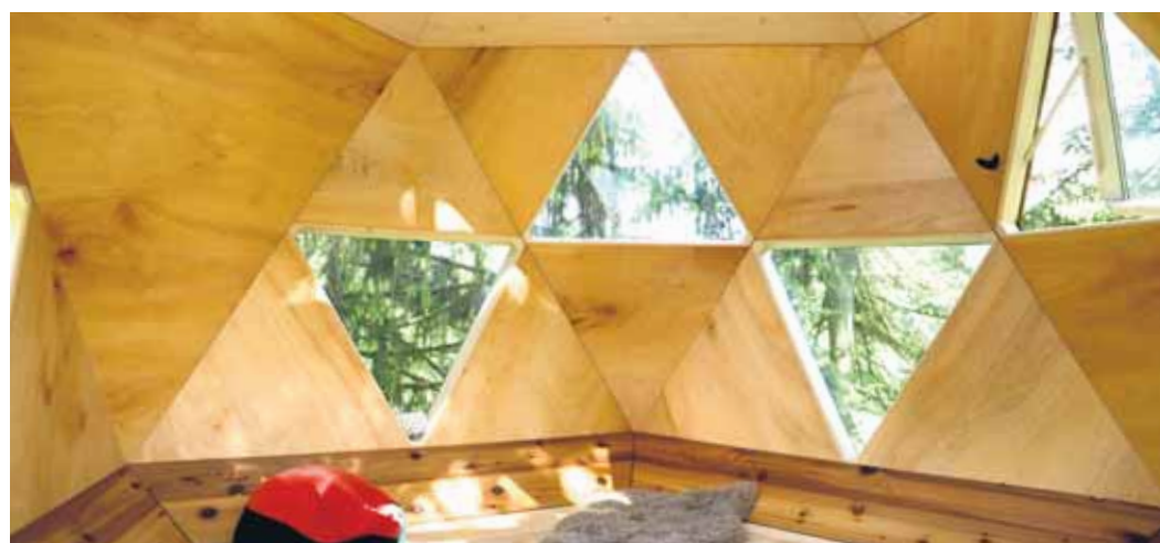
Weil sich nirgendwo rechte Winkel finden, wirkt das Innere des Raumes für das menschliche Auge ungewöhnlich.