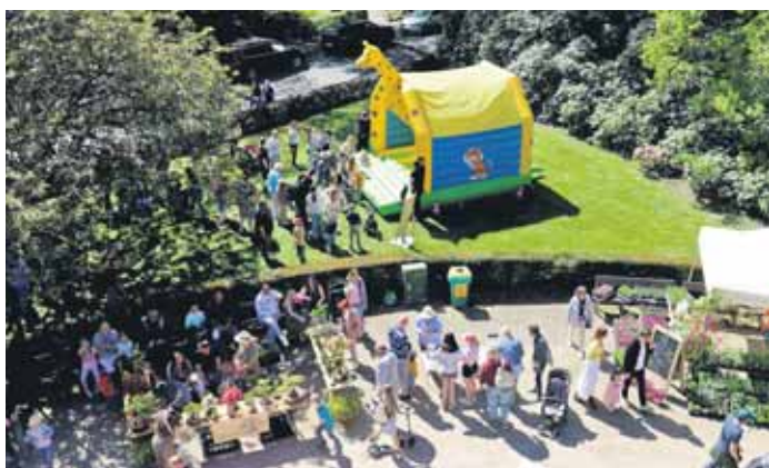
Etliche Verkaufsstände und eine Hüpfburg sorgten für Freude und Unterhaltung.

Die Feuerwehr Wuppertal zeigte ihre Katastrophenschutz-Fahrzeuge und die bei Familienfesten obligatorische Hüpfburg dürfte natürlich auch nicht fehlen.