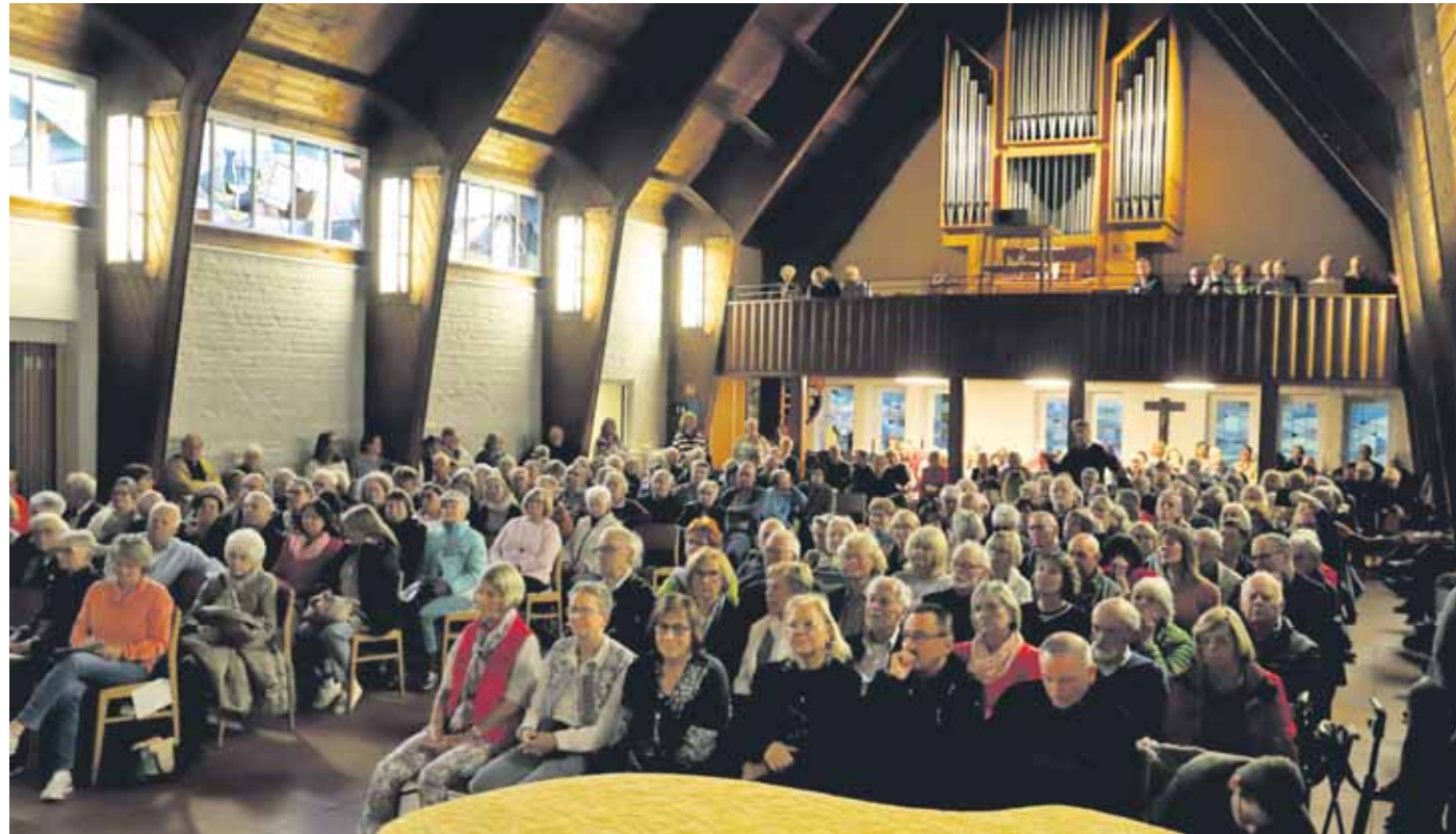
Die Johanneskirche war mit rund 300 Gästen am Donnerstagabend voll besetzt.

Schauspieler Harald Krassnitzer beim „Offenen Abend“ in der Johanneskirche