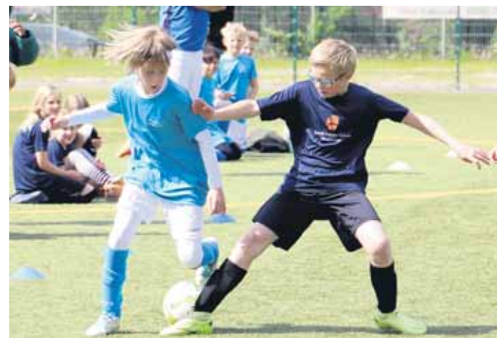
Titelverteidiger Marper Schulweg (in hellblauen Trikots) sicherte sich mit zwei Siegen die Teilnahme an der Zwischenrunde. Hier beim 2:1 gegen die Richard-Steiner-Schule.

Die Grundschule Engelbert-Wüster-Weg machte es da schon spannender, denn nach einer zweiten Niederlage – 1:5 gegen den Hammesberger Weg – musste im letzten Spiel gegen die Berg-Mark-Straße dringend ein Sieg her. Der wurde dann auch mit einem knappen 2:1 eingefahren und das