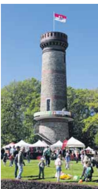
Der Toelleturm selbst war eine Attraktion beim Frühlingsfest des BVV.

naheliegenden Lichtscheider Ferremeldeturm am Westfalen-Wasserturm, sondern auch bis zum Kugelgasbehälter Möbeck, dem „Atadöskn“ und dem