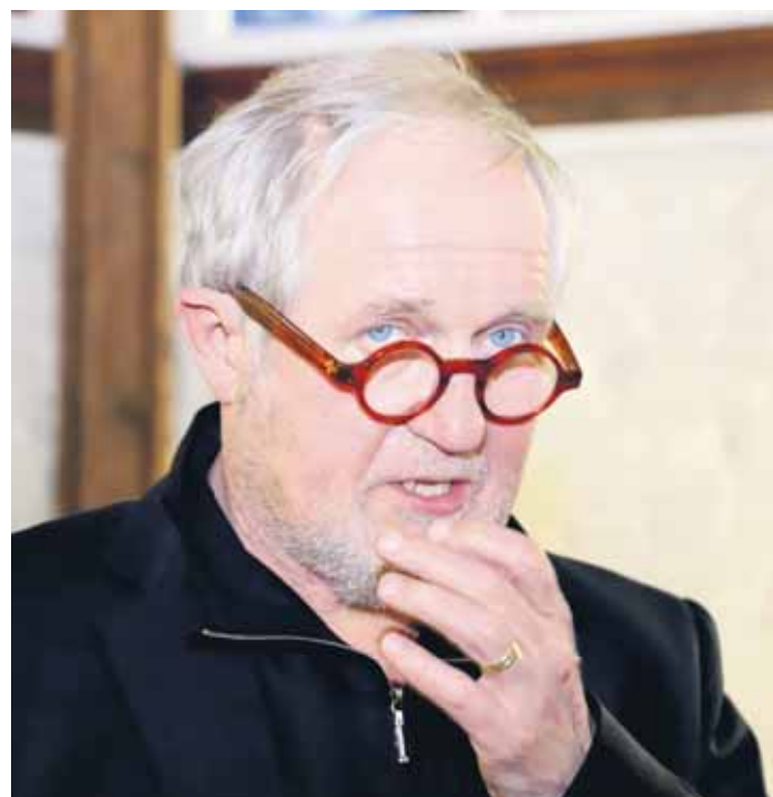
Harald Krassnitzer sieht viel Potenzial in seiner Wahlheimatstadt Wuppertal.

noch vorhanden. Mit dieser Aufgabe würde die Stadt auch wachsen.“ Krassnitzer fragt sich, warum es nicht gelinge, die Energie der Bürgerschaft in politische Maßnahmen umzu-