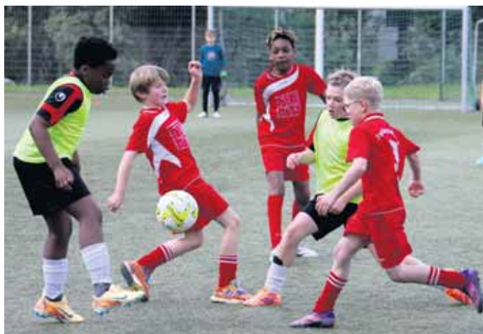
Im Ronsdorfer Derby behielt die Ferdinand-Lassalle-Straße (mit gelben Leibchen) gegen den Engelbert-Wüster-Weg mit 2:0 die Oberhand.

„Marpe“ und alle Ronsdorfer Schulen sind weiter