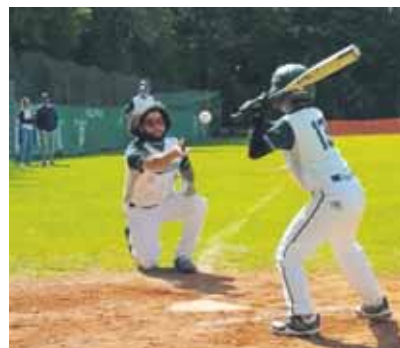
Ein erfolgreicher Schlag für das U12-Team der Stingrays.

(W.) Bei bestem Baseballwetter trafen sich am Wochenende die U12-Teams der Stingrays und der Spielgemeinschaft aus Krefeld und Düsseldorf (Crows und Senators),