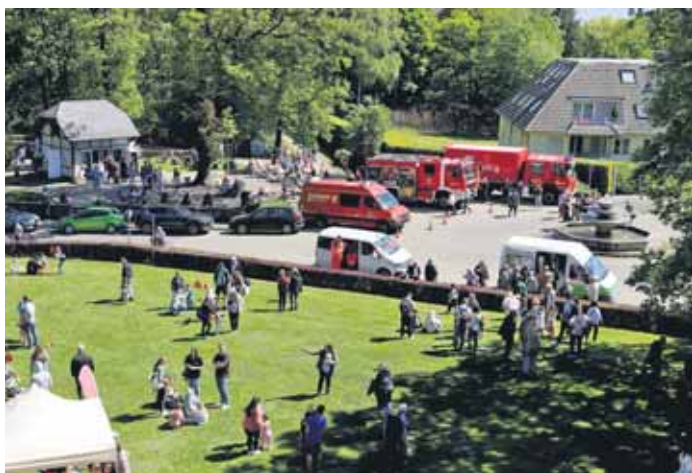
Feuerwehr-Fahrzeuge und ein Spiel-Parcours für Kinder lockten viele Gäste an. Auch für den Eisladen am Toelleturm dürfte es ein „Feiertag“ gewesen sein.

(Hb./LMP) Am 1. Mai, dem „Tag der Arbeit“, hatte der Barmer Verschönerungsverein (BVV) zu seinem traditionellen „Kinder- und Frühlingsfest“ rund um den Toelleturm eingeladen. Hunderte Ausflügler:innen fanden sich mit Kind und Kegel am Gelände an der Hohenzollernstraße ein und erfreuten sich an einem Spiel- und Bewegungsparcours für Kinder, Verkaufsständen mit Bonsai-Bäumchen, Blumen und künstlerischen Handarbeitsartikeln, aber natürlich auch an Speiseeis und Grillwürstchen.