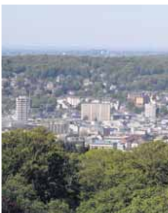
Atemberaubender Ausblick vom Toelleturm: hier über das Zentrum von Elberfeld, mit dem Sparkassen-Turm, dem Glanzstoff-Hochhaus, dem Alten Rathaus und der Friedhofskirche.