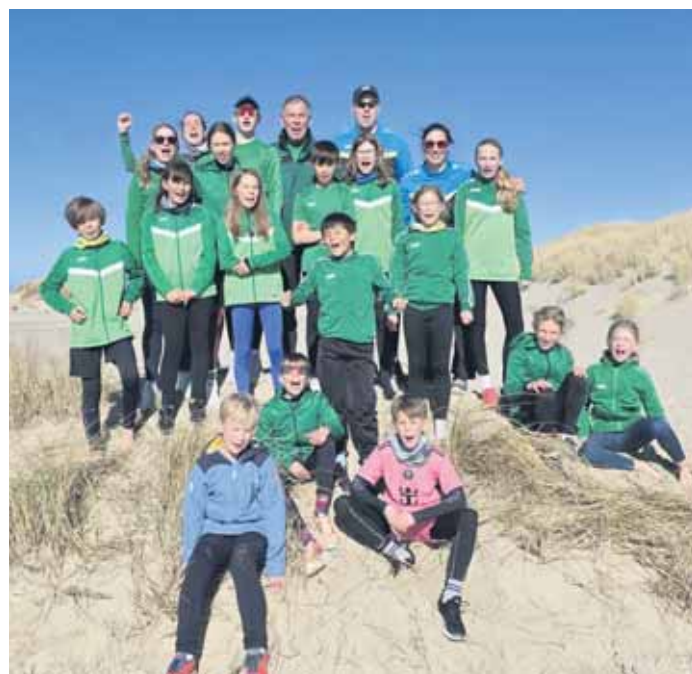
Viel Spaß hatte die Jugendgruppe des PSV Wuppertal in den Dünen der Insel Borkum.

Jugend des PSV Wuppertal genießt Gemeinschaft mit dem TSV Herdecke