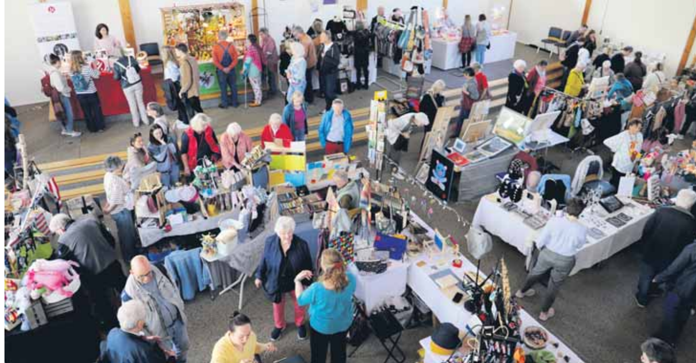
In den großzügigen Räumlichkeiten der Freien evangelischen Gemeinde (FeG) fanden beim „Kunstrausch“ diesmal 85 Ausstellungsstände ihren Platz.

Die Räumlichkeiten der Freien ev. Gemeinde boten ein tolles Ambiente