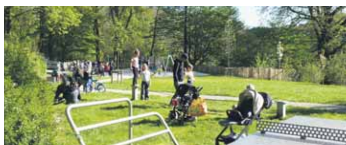
Der Spielplatz in dem Mehrgenerationenpark ist hervorragend angenommen worden.