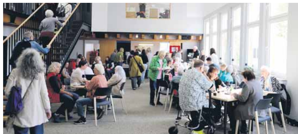
Die große Cafeteria lud zum Ausruhen und Verweilen ein.

Der „Kunstrausch“ bot also wieder einmal für jeden etwas. Der „zweite Samstag nach Ostern“ dürfte auch für 2027 schon jetzt in den Kalendern vorgemerkt sein.