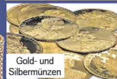
Gold- und Silbermünzen