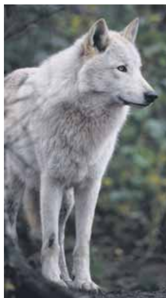
(W.) Am 25. April von 12 - 16 Uhr wird der Aktionstag „Wolf, Biber & Co“ veranstaltet, ein spannender Tag rund um Biodiversität in Bezug auf konflikt-

trächtige Tierarten. Die Veranstaltung ab fünf Jahren findet statt an der Station Natur und Umwelt unter der Leitung von Wiebke Foss. (Kurs: A260425, kostenfrei)