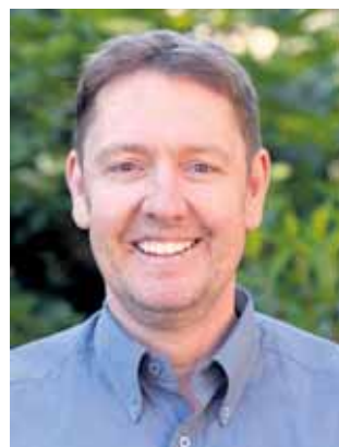
Lutz Kolitschus Ev. Kirchengemeinde, W.-Ronsdorf

Süselball und M&Ms – eine wahrhaft göttliche Kombination