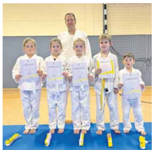
Erfolgreich absolvierte der Judo-Nachwuchs die Gürtelprüfungen.

Auch Disziplin, Respekt und Teamgeist sind wichtige Bausteine