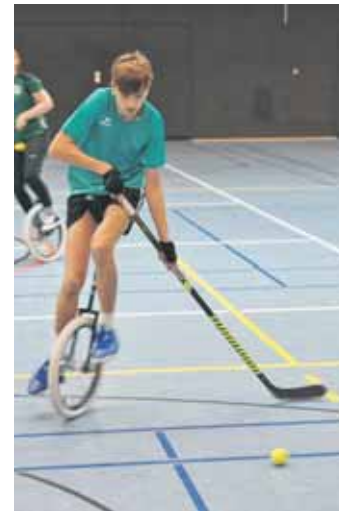
Balance, Konzentration und Beweglichkeit sind hier gefragt.

Teamnamen: „Krumme Speichen“ und „Gurkentruppe“