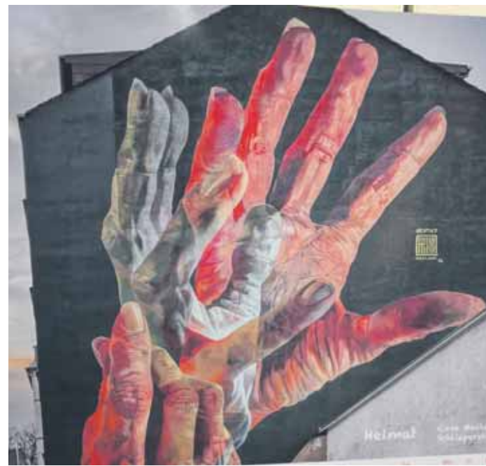
Die Hände sind die Sprache gehörloser Menschen. Die Hände auf diesem Mural sagen „Heimat“.

In Sonnborn in einem Hinterhof prangt ein komplettes Alpenmotiv. Anderswo ist eine „aufgeschnittene Haushälfte“ zu sehen. Und auch in Ronsdorf hat die Mural-Kunst Einzug gehalten: Auf privater Ebene kann man in der Lilienstraße fündig werden (eine Frau, die Gitarre spielt). Am Hochhaus an der Parkstraße befasst sich ein zweigeteiltes großflä-