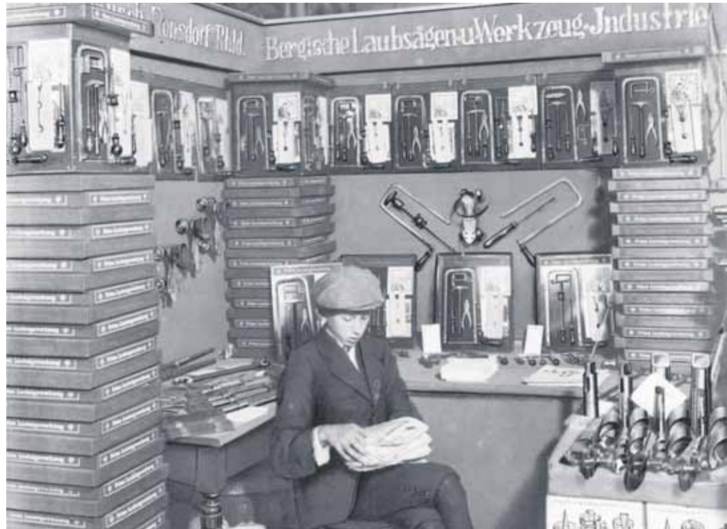
So sah es auf der Frühjahrsmesse in Leipzig im Gründungsjahr 1919 aus.

Ein 1919 gegründetes Ronsdorfer Familienunternehmen feierte Jubiläum