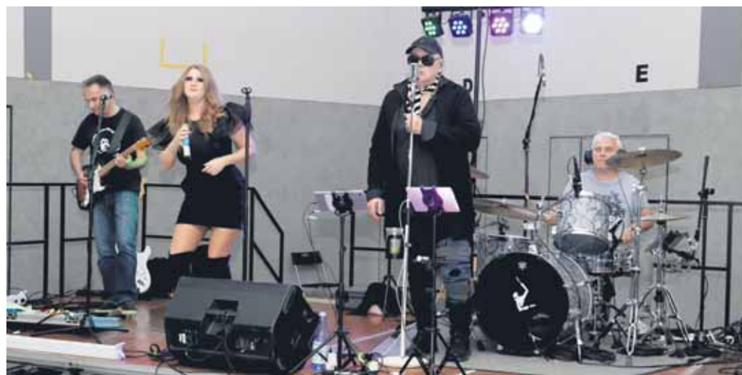
Die „Alten Schweden“ begeisterten ihr Publikum auf der Bundeshöhe mit einem mitreißenden Partyrock-Repertoire.

Partyrock vom Allerfeinsten auf der Bundeshöhe