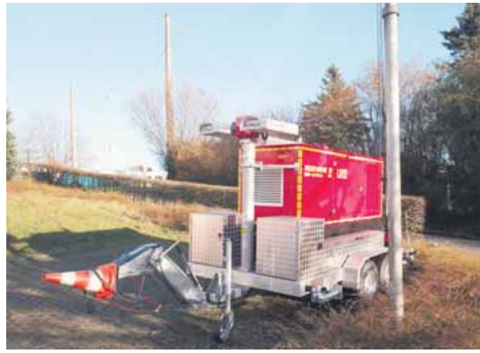
Mit den mobil einsetzbaren Netzersatzanlagen kann die Stromversorgung gesichert werden.

(Ro.) Seit einigen Tagen wurde dem Löschzug (LZ 14) Ronsdorf an der Talsperrenstraße ein mobiler Netzersatzanlagenanhänger (NEA) mit 60 kVA zugewiesen.