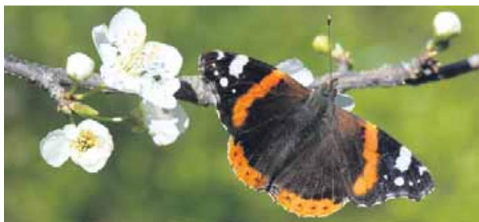
Der schöne Admiral