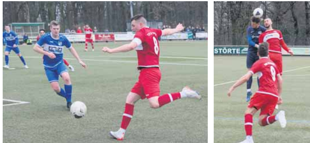
Mit Dynamik und Spielfreude – wie hier im Spiel gegen Germania – sollte sich der TSV in den nächsten Begegnungen aus der Gefahrenzone absetzen können.

Der TSV 05 Ronsdorf konnte gegen den Tabellenletzten in der Bezirksliga nicht gewinnen und musste sich beim 2:2 gegen die SSVg 09/12 Heiligenhaus mit einem Pünktchen begnügen. Der Abstand zu den gefährdeten Rängen beträgt aktuell fünf Punkte. Am Sonntag ist der TSV Gastgeber in der Partie gegen die 1. Spvg. Solingen-Wald, dem starken Ta-