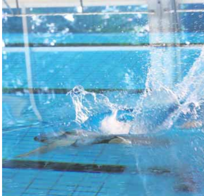
Das Bandwirker-Bad will sich beim Schwimm-Olymp von seiner besten Seite präsentieren, außen wie innen.