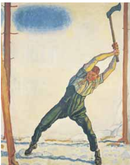
Ferdinand Hodlers „Der Holzfäller“ gehört zu den 100 Klassikern.

Am Donnerstag, 18. April, stellt sie in der Johanneskirche die neue Auswahl an Klassikern der Ausstellung vor, die vom 17. Jahrhundert bei den alten Niederländern beginnt und bis ins 20. Jahrhundert reicht. Zudem berichtet sie