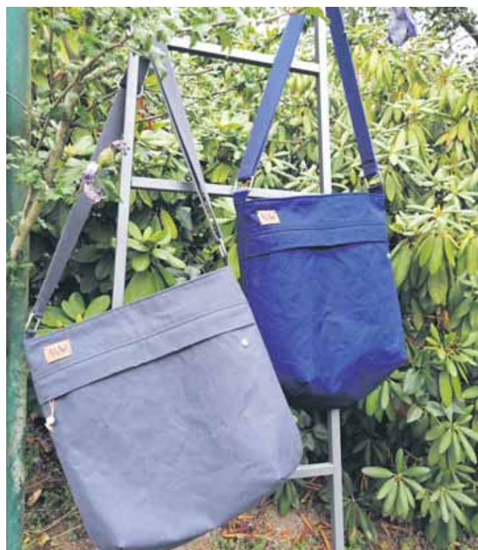
Schmucke Taschen laden ein, einiges auf dem Kunststrausch zu erstehen.

„Kunstrausch“ am 13. April bei der ref. Gemeinde