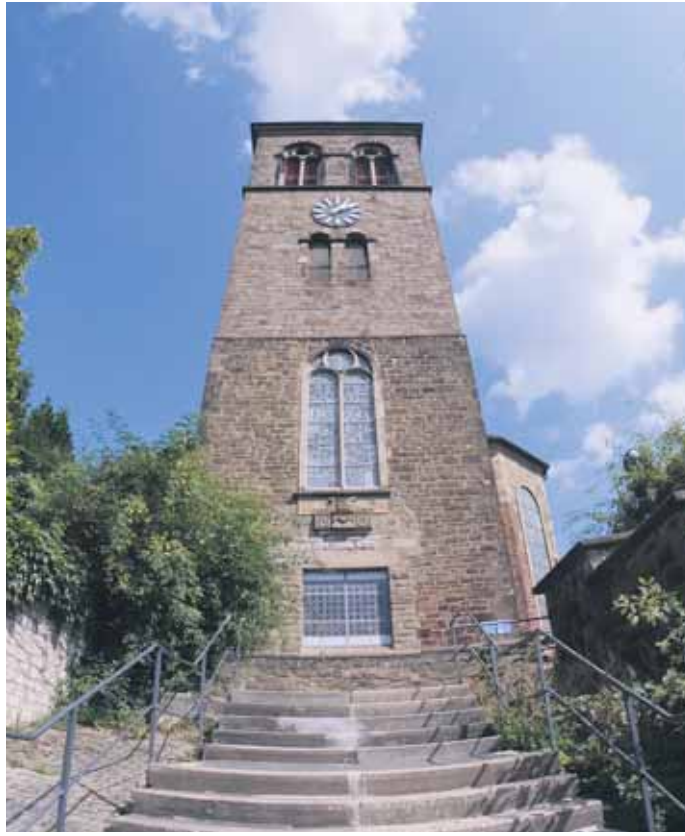
Während der Sanierungsdauer bleibt die „Luthertreppe“ gesperrt.

Wegen der Topographie kann die Treppe Staatsstraße nicht behindertengerecht gestaltet werden. Aber sie soll behindertenfreundlicher werden. Dies heißt, dass vor dem obersten Treppenlauf ein Aufmerksamkeitsfeld angebracht und jeweils die erste und letzte Stu-